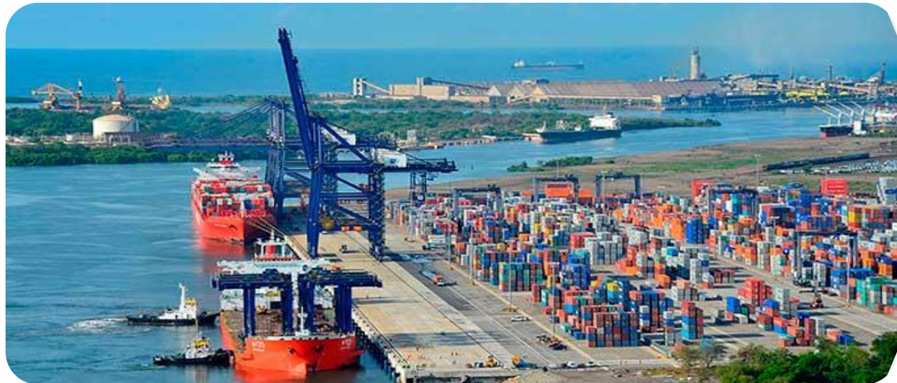
“MIRANDO AL SUR”